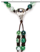
NHS1500-140 (A. grün gestreift)