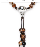
NHS1500-94 (A. braun gestreift)