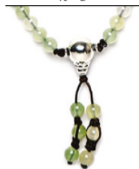
NHS1500-63 (A. apfelgrün)