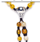
NHS1500-155 (A. gelb gestreift)