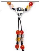
NHS1500-118 (A. rot gestreift)